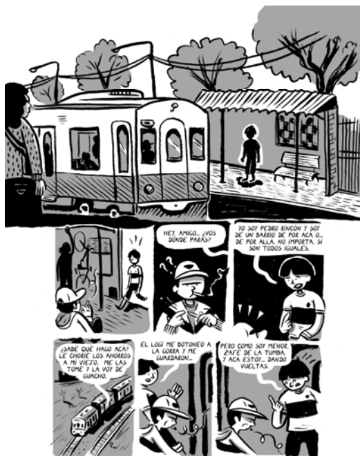
Rinconete y Cortadillo, Alejandro Farías/Otto Zaiser