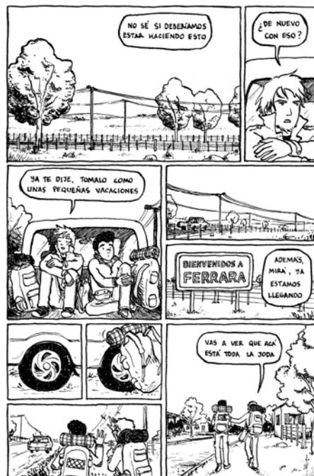
La señora Cornelia

LIBRO DE HISTORIETAS ADAPTACIÓN DE LAS DOCE OBRAS DE MIGUEL DE CERVANTES EN EL CUARTO CENTENARIO DE SU PUBLICACIÓN