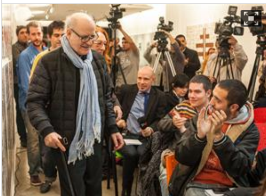
"Mafalda nació así: creía que el mundo iba a..."