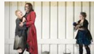
Kiri Te Kanawa apoya a la cantante Tara Erraughtla criticada por su sobrepeso EFE - Londres