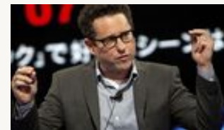
"Star Wars" invita a donar dinero para Unicef y ser parte del "Episode VII" EFE - Los Ángeles (EE.UU.)