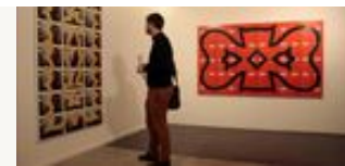
desempolva la obra inédita del pintor español Néstor Sanmiguel EFE - Buenos Aires

Su presencia en Buenos Aires responde también a su participación en la feria de arte de Buenos Aires, ArteBA, que comienza el próximo viernes en la capital argentina, y a la que el pintor llega de