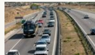
Activada la fase crítica de seguridad para la final, con 1.250 agentes EFE - Madrid