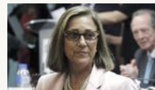
Los corresponsales extranjeros premian a Efe en su 75 aniversario EFE - Madrid