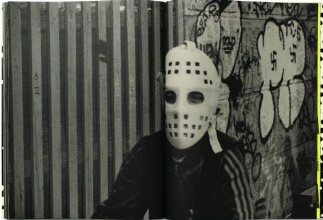
Retromundo, Paolo Gasparini, Caracas, Venezuela, 1986

Y en la sede Paraná del Centro Cultural de España se muestra América antes de América / Historia y Propaganda. Con importantes trabajos que remiten al continente antes de la llegada de Colón: una muestra el paisaje y sus primeros habitantes, el otro las culturas que destruyó la colonia.