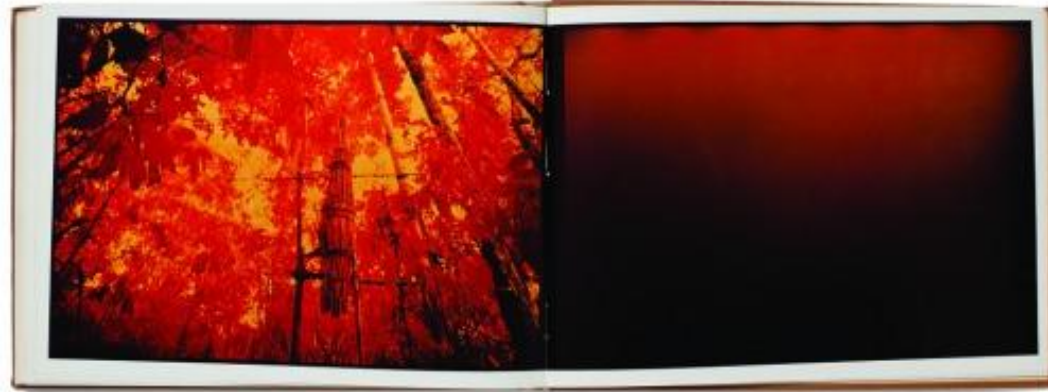
Amazonia, Claudia Andujar/ George Love, São Paulo, 1978

A pesar de su riqueza, los fotolibros latinoamericanos son casi desconocidos. Su redescubrimiento ha sido calificado por el historiador como “el secreto mejor guardado de la historia de la fotografía”, cuyo canon está cambiando en los últimos tiempos por el creciente aprecio de los fotolibros en todo el mundo.