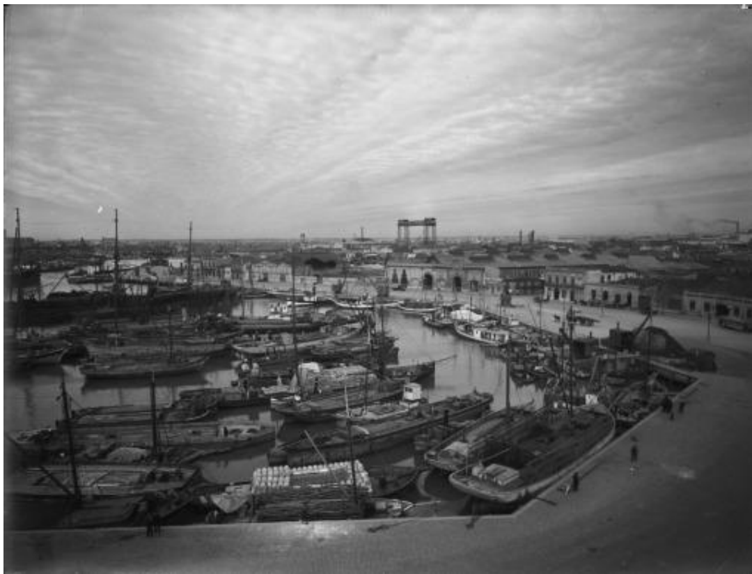
Coppola.La vuelta de Rocha