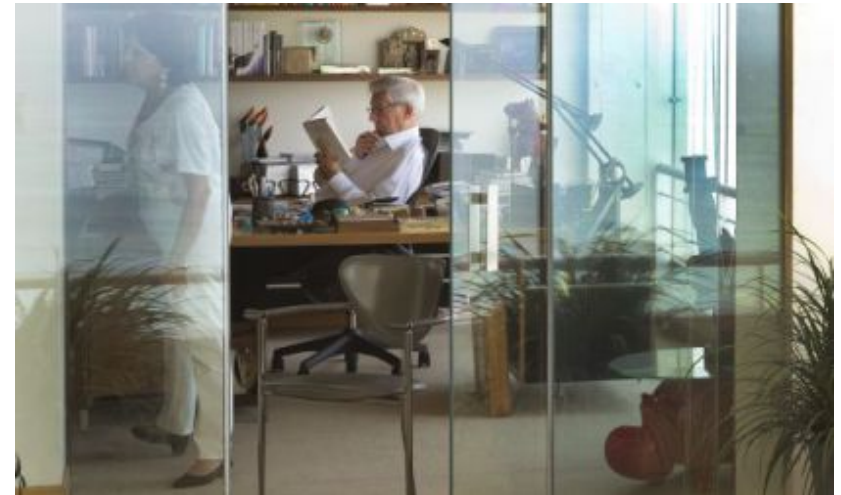
Mario Vargas Llosa en su casa de Lima.