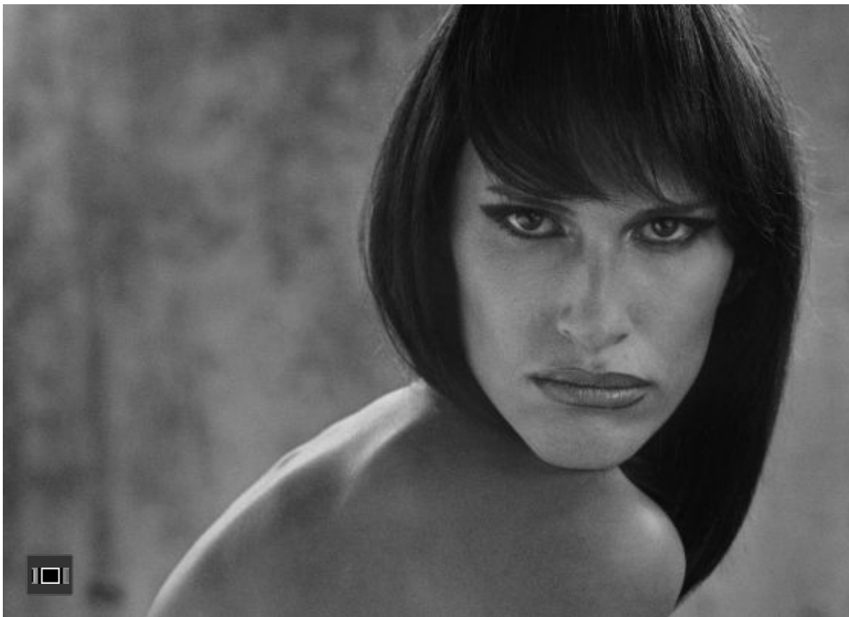
'La gata', 1998, en la muestra del Bellas Artes de Buenos Aires. / ALBERTO GARCÍA-ALIX